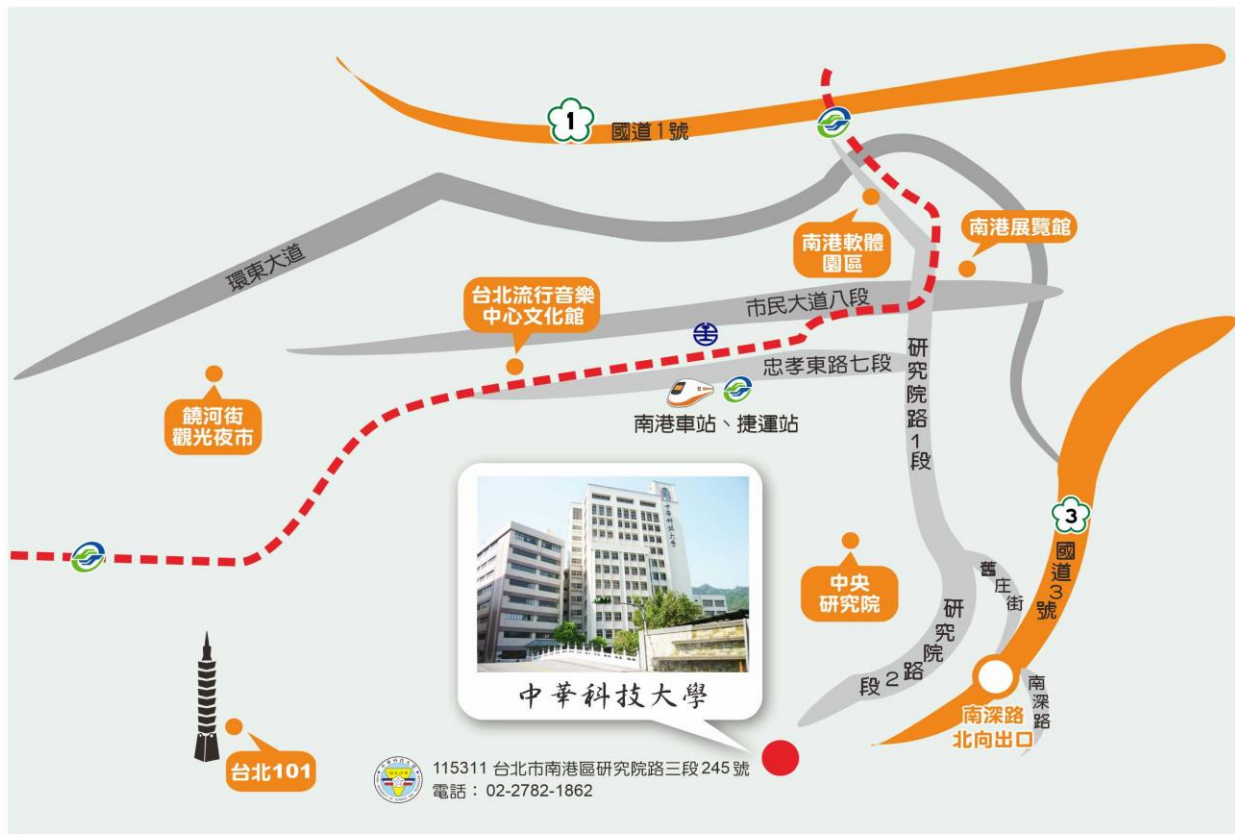
【附表 12】中華科技大學位置圖及交通路線說明(台北校區)