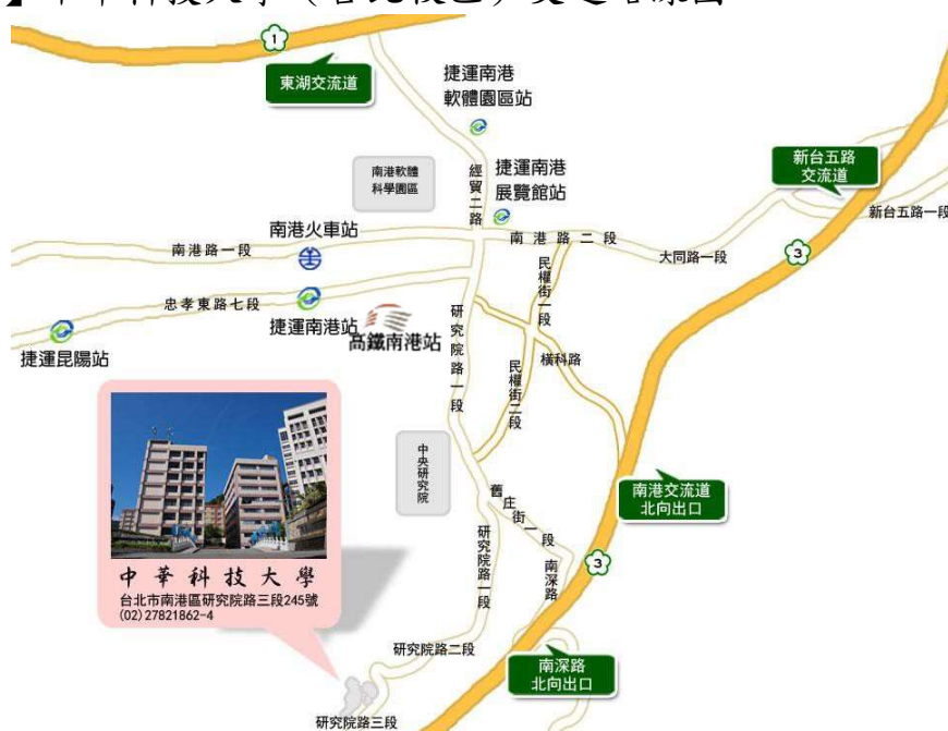
【附圖一】中華科技大學（台北校區）交通路線圖