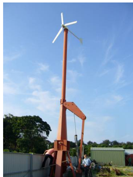
圖 7、人工風力葉片性能測試

航空飛行器及風力發電複合材料設計、製造、檢測、修補特色實驗室建立複合材料已具其特殊性及發展性，是材料體系的一個重要的學門，然而，複合