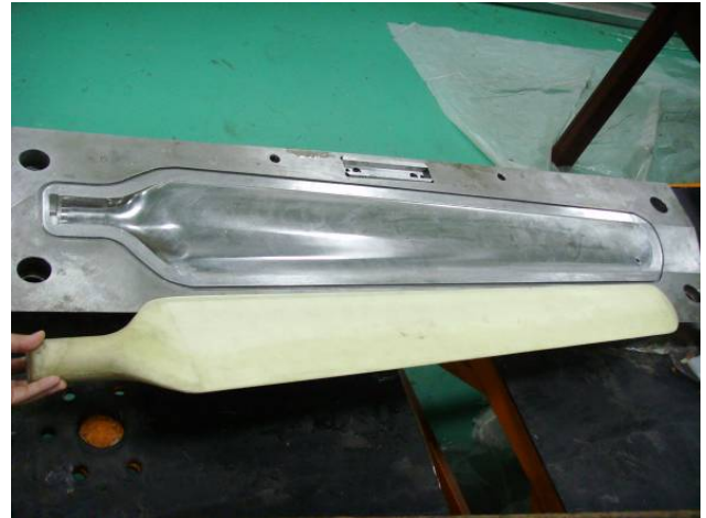
圖 5、複合材料風車葉片成型