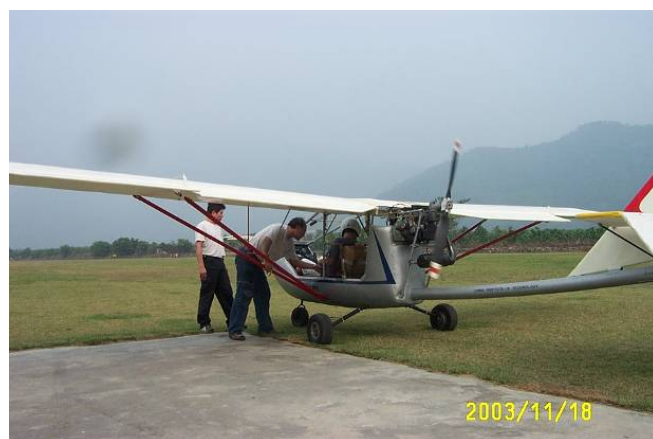
圖 3. 本校超輕複材飛機試飛

近期有關綠色能源開發之需求，學校已投入複合材料風力發電開發計畫，近期航空機械系結合機械系合作共同執行國科會整合型計畫，執行複合材料風力發電葉片之設計製作研究，應用本校資源設計製造一系高效率之複合材料風力發電機葉片。因為複合材料具有以上種種優點，所以利用複合材料優異特性，針對風力發電機渦輪葉片的需求，設計製作小型 1kw ~3kw 風力發電機渦輪葉片。利用複合材料具有高強度與勁度、低密度、易製作、環境穩定度及優良的抗疲勞性，滿足風力發電機渦輪葉片的需求，設計風力發電機渦輪葉片結構，執行風力發電渦輪葉片的製作等，經葉片初步及細步設計得到最佳外型風力機葉片幾何外型後，引用航空器設計製造及維修等成功經驗及方法應用於風力機