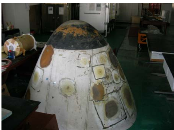
圖 2. 複合材料飛機機頭修補實體

目前中華技術學院已建立了飛機設計製作複合材料修補研究與教學之初步能量，除已開設複合材料製造修補課程為業界培訓人才外，已具成熟之複合材料製造，真空袋成型、三明治結構、蜂巢結構製程與修補(圖 1.)，配合航空飛機維修人員專長訓練，訓練複合材料修補專業人員。並且開發纖維材加工、製作、複合材料非破壞性檢驗等相關技術及課程。同時，鼓勵研究自行研究設計及製作可載人之複合材料超輕航機(圖 2.)，研究自製複合材飛機，搭配飛機氣動力及結構力學設計輕且結構強之短場起降飛機，其機身、機翼結構採用高強度的玻璃纖維及碳纖維複合材料，內部結構及部分肋樑採用高強度纖維三明治結構材料，並應用 CNC 機具加工製作模型，選用模具配合熱處理爐及真空加壓成型法加工製作。同時，配合推動飛航安全各項航空材料先經過測試檢驗及品質檢驗，建立材料性能資料與設計標準依據，最後該飛機已完成飛機試飛。