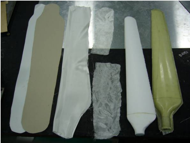
圖 4、複合維編織材料

組上，設計製作小型風力發電機複合材料葉片，葉片製程方面分別利用了樹脂轉注成型法(Resin Transfer Molding RTM)、真空樹脂轉注成型法(Vacuum Resin Transfer Molding VARTM)及手積塗層法等三種方法。包括樹脂轉注法(RTM)之鋼模具設計製作，以及研究各種玻璃纖維三明治複合材料葉片設計製作技術，已能製作一材質輕結構強抗強風型、且能耐疲勞、日曬雨淋，以及能搭接風力發電機葉輪轉軸之金屬及玻璃纖維接頭。