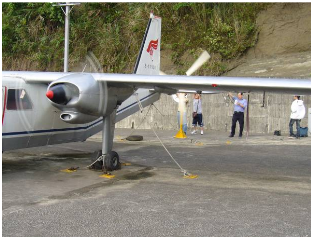
圖 6、飛機人工風場測試風力發電性能